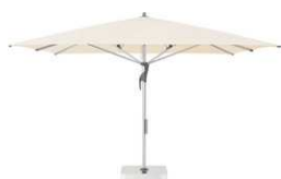
FL FR FI F-Linie Fortello®, Fortero®, Fortino® Riviera