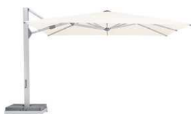
AMB AMBIENTE Nova La reina entre las sombrillas de mástil lateral