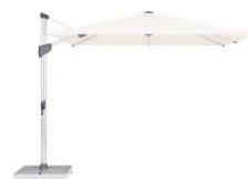
FA FORTANO® La sombrilla de mástil lateral a prueba de viento