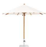
TW TEAKWOOD La elegante obra maestra en madera noble