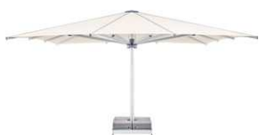
PZR PZN PZS PALAZZO®-Linie Royal, Noblesse, Style