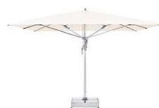
CAS CASTELLO® Pro La versátil todoterreno