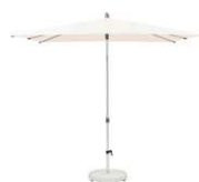
AS ALU-SMART La sombrilla pequeña y adaptable