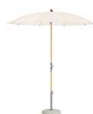
AL ALEXO® Un clásico desde 1931