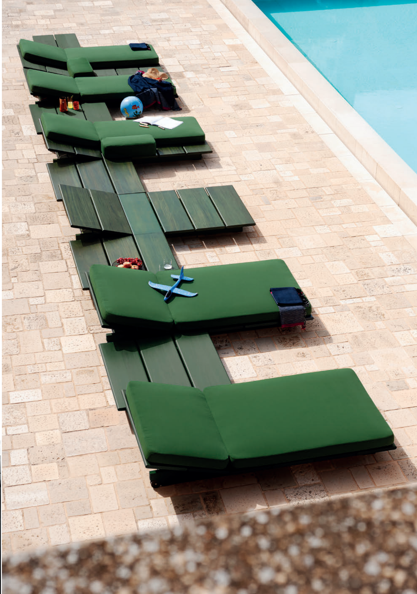
EOLIE, design Gordon Guillaumier