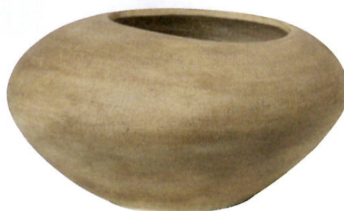
ÜBERTOPF »DODU POT« FERM LIVING Preis 405 Euro