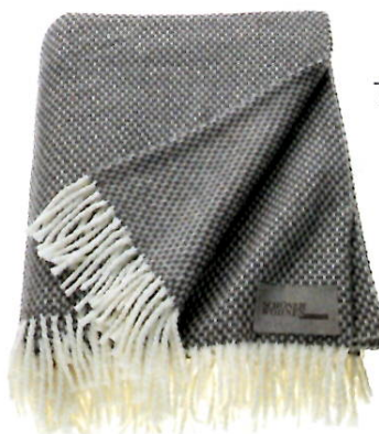
PLAID »ZEN« SCHÖNER WOHNEN- KOLLEKTION Preis 69 Euro