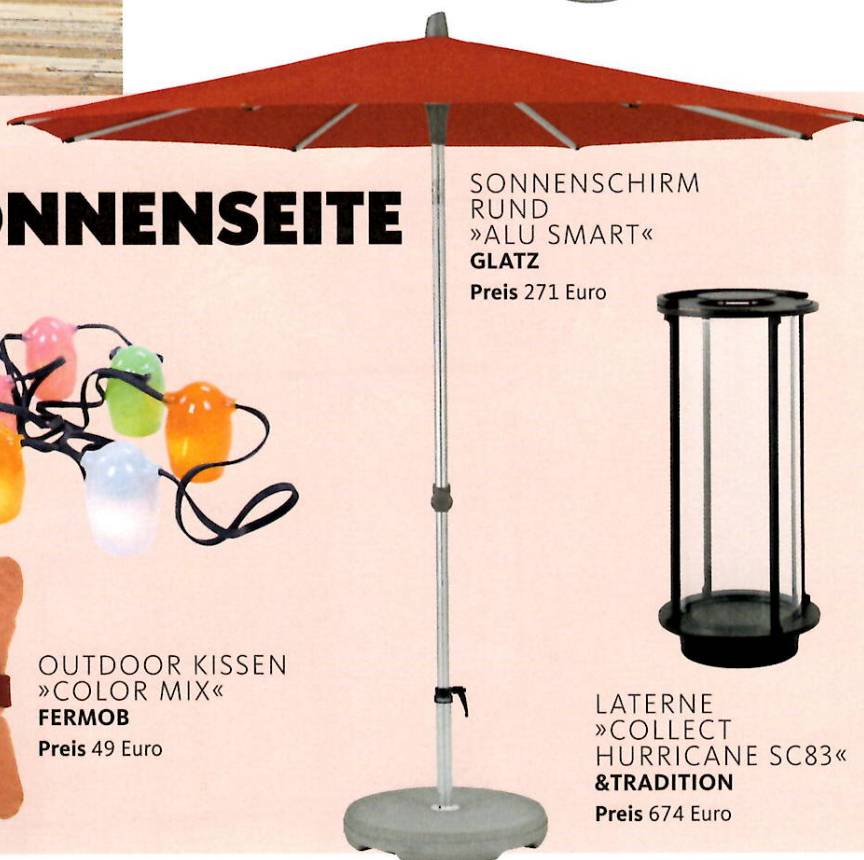
SONNENSCHIRM RUND »ALU SMART« GLATZ Preis 271 Euro