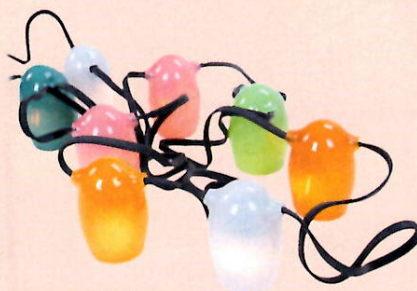
LICHTERKETTE »STRINGLIGHT« WELTEVREE Preis 379 Euro