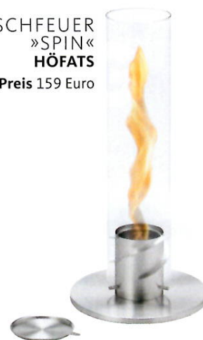
TISCHFEUER »SPIN« HÖFATS Preis 159 Euro