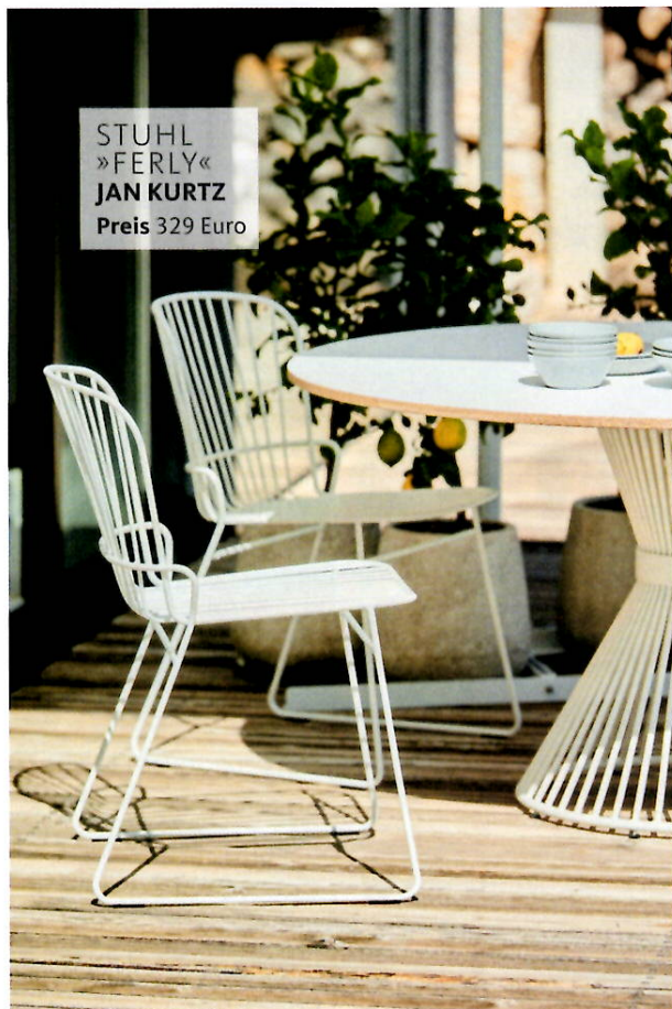
STUHL »FERLY« JAN KURTZ Preis 329 Euro