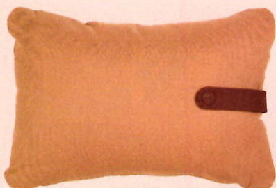
OUTDOOR KISSEN »COLOR MIX« FERMOB Preis 49 Euro